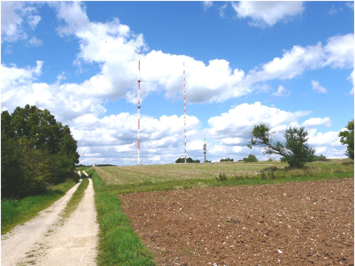
Sendemasten des Bayerischen Rundfunks auf dem Dillberg

Wanderung von Pölling über die Heinzburg und den Dillberg nach Burgthann