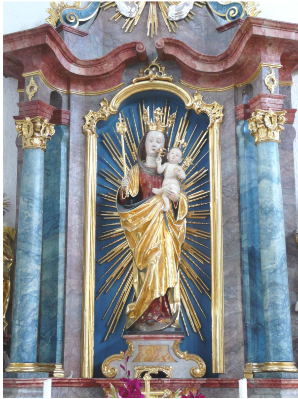
Mondsichel-Madonna in der Kirche von Pölling