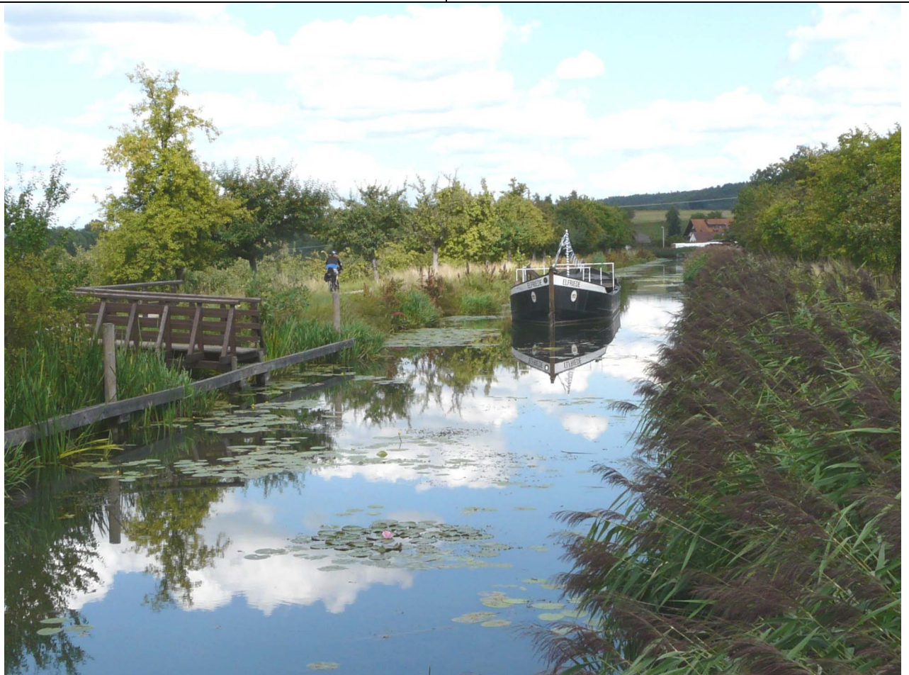
Treidelschiff auf dem Ludwigskanal bei Schwarzenbach