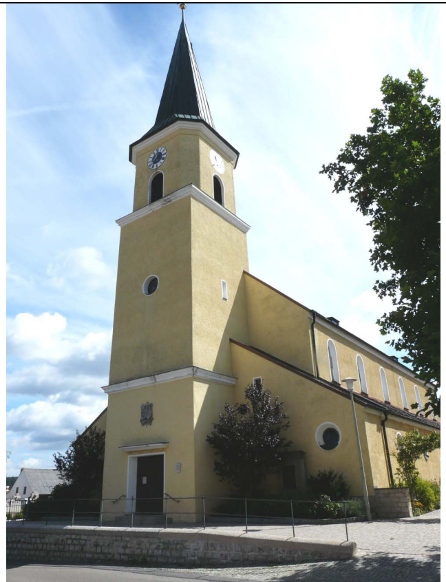
Pfarrkirche St. Martin in Pölling