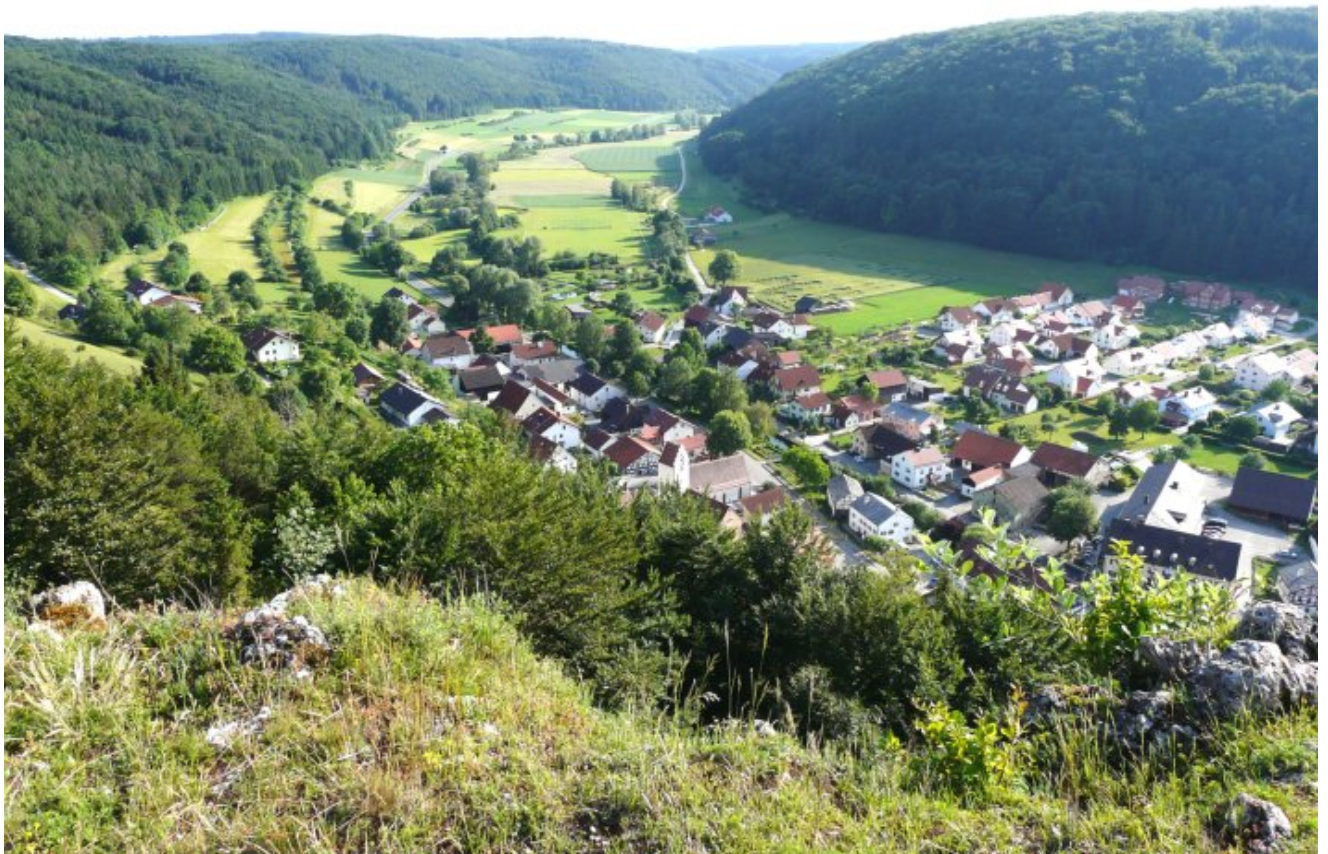
Blick vom Schellenberg auf das Anlautertal und Enkering