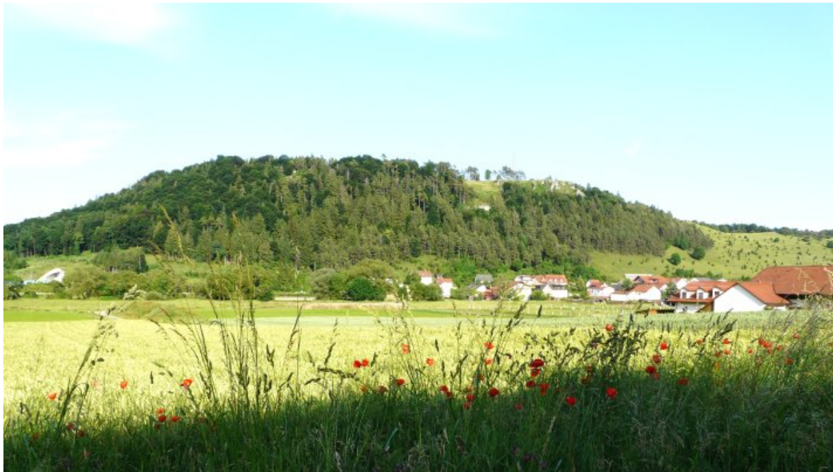
Blick auf den Schellenberg von Norden

Wanderung von Ilbling im Altmühltal auf den Schellenberg