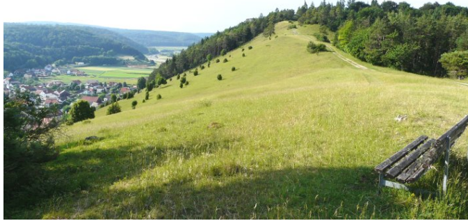
Das einst von den Kelten besiedelte Plateau des Schellenbergs