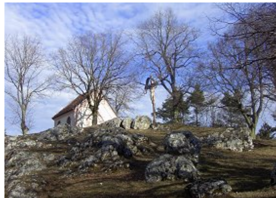
„Golgotha“ in Gosheim

Die Lage Gosheims am Rande des Ries verführt zum Wandern, vor allem zu einem weiteren großartigen Aussichtspunkt, dem Mähhorn, und nach Huisheim mit seiner sehenswerten Kirche. Auf dem Rückweg präsentiert sich das Ensemble aus Schloss und Kirche als „Krone“ und weithin sichtbares städtebauliches Zentrum des Ortes.