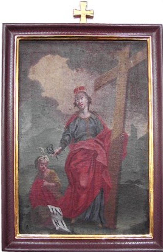
15. Station des Kreuzweges in der Kirche in Gosheim: Die Hl. Helena mit dem von ihr gefundenen Kreuz Christi