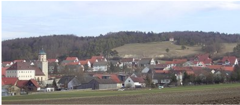
Blick auf den Ort und den Kalvarienberg, auf den der Kreuzweg führt

Von Kreuzwegstation zu Kreuzwegstation das Leiden Christi in Gosheim nachempfinden