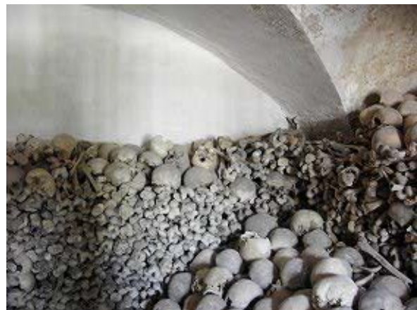
Michaelskapelle (links) mit Karner (rechts)