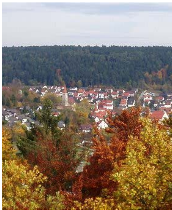
Blick auf Greding