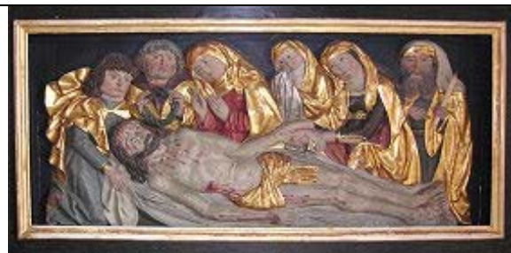
Beweinung (Christi Predella)