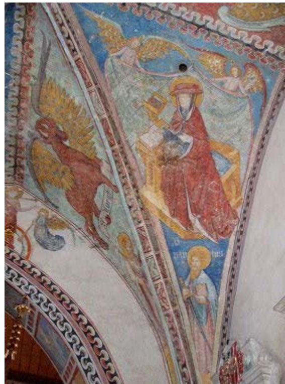
Fresken im Chorraum: Kirchenlehrer Ambrosius, Apostel Paulus und Symbol des Evangelisten Lukas Links: Epitaph mit Auferstehung Christi (Loy Hering)