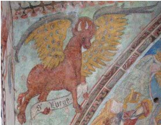
Der Stier – Symbol des Evangelisten Lukas

23. August 1986. Schauplatz: Das Dorf Ostheim. Es tobt ein heftiges Gewitter. Ein Blitz schlägt in die um 1310 erbaute Chorturmkirche ein und setzt das Dach in Flammen. Der Dachstuhl und das Turmgebälk brechen zusammen, die Orgel und die Empore brennen, die vier Glocken schmelzen. Wie durch ein Wunder hält das Gewölbe des Chors den herabstürzenden Erzklumpen stand. Aber das Löschwasser hat den Taubenkot, der sich im Turm angesammelt hatte, aufgeweicht und sickert nun durch das Gewölbe in die wertvollen Fresken des Chors aus dem 14./15. Jahrhundert ein. Fast drei Jahre dauern die Arbeiten am Wiederaufbau der Kirche und die langwierigen Renovierungsarbeiten an den Fresken.