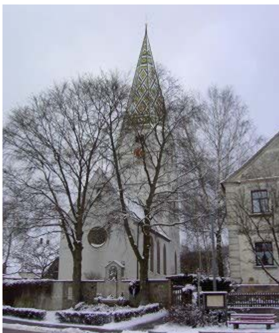
Die evangelische Kirche St. Michael in Ostheim

Ausgangspunkt: Westheim an der B 466 zwischen Öttingen und Gunzenhausen, ca. 7 km nördlich von Öttingen