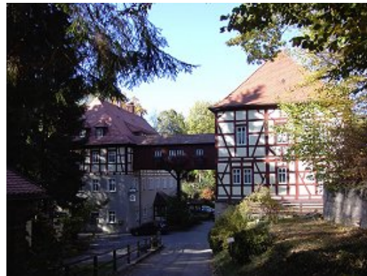
Das ehemalige Wildbad