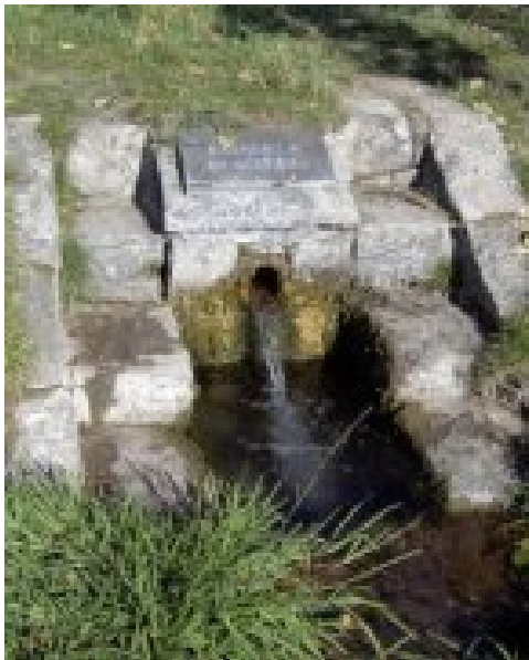
Altmühlquelle bei der Erlachsiedlung

Gemeinde Burgbernheim wird bereits im Urkataster, aber auch noch in der aktuellen topographischen Karte als „Ursprung der Altmühl“ ausgewiesen. Der zweite „Ursprung der Altmühl“ ist der Hornauer Weiher, ein vor Jahrhunderten aufgestauter Mühlweiher. In ihn fließt neben anderen Quellbächen auch das Wasser des „Altmühlgrabens“, das der Hirschteich abgibt – wenn er nicht ausgetrocknet ist. Denn abhängig von den Niederschlägen führt er verschieden viel und manchmal gar kein Wasser.