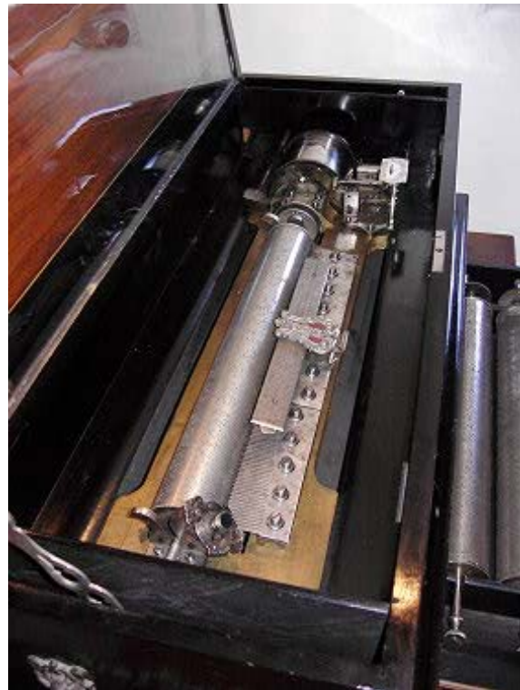
Momod Freres Zylinderspieldose

Im Wirtshaus „ Zum Goldenen Löwen“ herrscht heute, an einem Wintertag des Jahres 1887, großer Andrang. Der Grund: In der Gaststube steht seit gestern ein geheimnisvoller hölzerner Kasten. Unter den Augen der neugierigen Gäste steckt der Wirt in den kleinen Schlitz an der Seite des unbekanntem Möbelstücks einen Groschen, und schon beginnt sich zum Staunen aller die durchlöchernte Metallscheibe hinter der gläsernen Schranktür zu drehen und es erklingt Musik, so echt, als musizierte im Kasten ein ganzes Orchester. - Für die Menschen von damals war das wohl ein kleines Wunder, hatte man doch nur zwei Möglichkeiten, wenn man Musik hören wollte: Man musste entweder selbst musizieren oder eben dorthin gehen, wo gerade Musik gemacht wurde. Und jetzt machte plötzlich ein Automat das Musikhören zu jeder Zeit, an jedem Ort möglich!