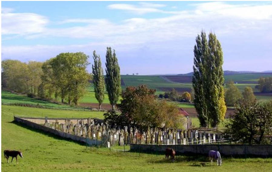
Judenfriedhof in Hainsfarth mit 272 Grabsteinen

Auf den Spuren jüdischer Vergangenheit an der Westgrenze des Bistums Eichstätt