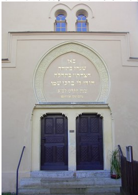
Portal der Synagoge Hainsfarth

“Geht zu seinen Toren ein mit Dank, in seine Vorhöfe mit Lobgesang! Dantk ihm, preist seinen Namen – im Jahr 5619 seit Erschaffung der Welt“ (= 1859/60). Diese Worte des Psalms 100 in hebräischer Sprache im Blindbogenfeld über dem Eingang der mächtigen ehemaligen Synagoge in Hainsfarth zeugen noch heute davon, dass hier einst eine große jüdische Gemeinde das Lob Jahwes verkündete. Um 1800 war fast jeder zweite der 800 Einwohner jüdischen Glaubens, 1864 waren von 1366 Einwohnern 532 Juden. Ein Grund dafür, dass sich hier so viele Juden niederließen - man nannte Hainsfarth sogar das „Judendorf“ - war die liberale Ansiedlungspolitik der Fürsten von Oettingen-Spielberg, in deren Besitz der Ort bis zum Beginn des 19. Jahrhunderts war. Das Fürstenhaus gewährte den Juden Schutz, dafür hatten sie ihrerseits Schutzgeld zu bezahlen. Sie lebten vornehmlich vom Viehhandel, im frühen 19. Jh. verstärkt auch vom Textil- und Gemischtwarenhandel.