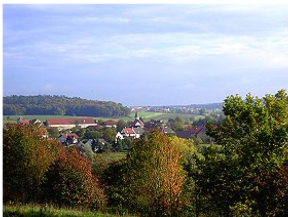
Steinhart im Hahnenkamm